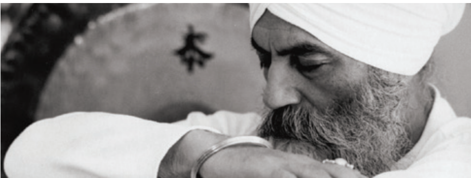
YOGI BHAJAN, KUNDALIINIJOOGAN MESTARI

Tämän 220-tuntisen, noin 12 kuukauden koulutuksen aikana tulet osaksi kannustavaa kansainvälistä yhteisöä, joka jakaa kanssasi syvän tutkimusmatkan.